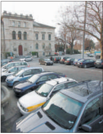
Die Autoreifen wurden unter anderem auf dem unteren Postplatz beschädigt.

red. Nach einer Serie von Sachbeschädigungen an Autos sucht die Zuger Polizei Zeugen. So sind in der Nacht von Mittwoch auf gestern Donnerstag, zwischen zirka 23.45 und 6 Uhr, in Zug auf dem Parkplatz am Unteren Postplatz sowie an der Seestrasse, auf dem Parkplatz beim Regierungsgebäude, an vier Autos die Pneus zerstochen worden. Eine unbekannte Täterschaft zerstach mit einem scharfen Gegenstand insgesamt 13 Reifen. Bei den Fahrzeugen handelt es sich um einen Saab 9.3, einen VW Passat, einen Nissan Primera sowie einen Jaguar S-Type. Dabei entstand ein Sachschaden von mehreren tausend Franken. Sämtliche Fahrzeugreifen weisen ähnlich grosse Schnitte auf. Die betroffenen Fahrzeuge waren in einem Umkreis von rund 30 Metern parkiert.