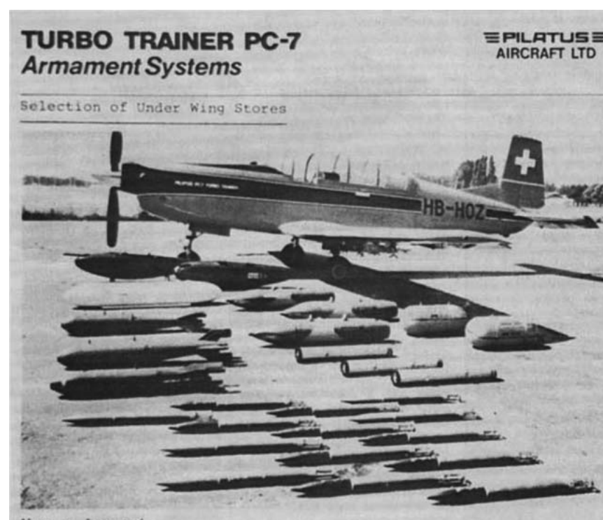
Bewaffnung eines PC-7-Flugzeugs, wie es beispielsweise an Burma geliefert wurde.