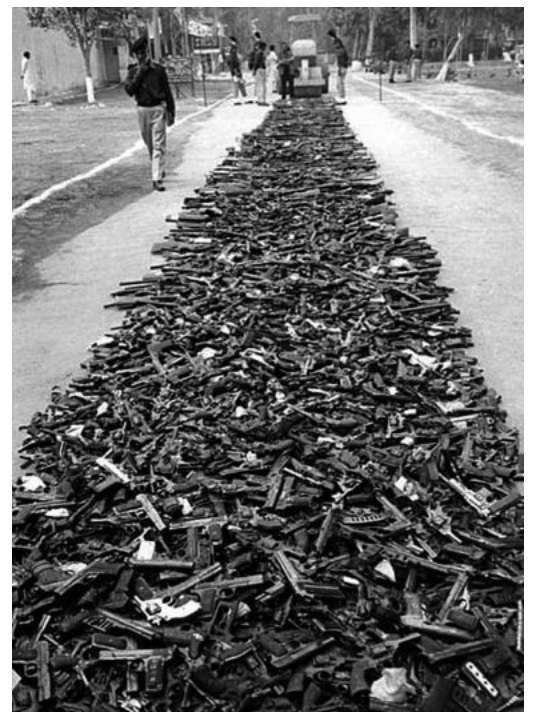
Waffensammel-Aktion in einem südasiatischen Land

ziger Kanton Konsequenzen gezogen und angekündigt, die Aktion aufgrund der vielen Abgaben auch nächstes Jahr wieder durchzuführen. Währenddessen wurde vom VBS bekannt gegeben, dass 100 Soldaten ihre Waffe vorläufig abgeben müssen, weil bei ihnen eine Missbrauchsgefahr bestehe. Beim Feststellen dieser Missbrauchsgefahr ist die Armee einzig auf Hinweise aus dem Umfeld dieser Personen angewiesen. Statt das Problem grundsätzlich anzupacken und die Armeewaffen im Zeughaus zu lagern, wird ein wenig Kosmetik betrieben.