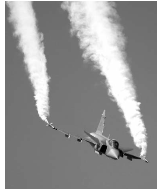
Die Chancen für den Kauf der neuen Kampffjets stehen schlechter denn je.

Und noch etwas zeigt die Verschiebung der Kampffliegerbeschaffung: So existenziell für die Sicherheit der Schweiz können diese Flugzeuge nicht sein. Ursprünglich war geplant, dem Parlament die Beschaffung der neuen Flugzeuge mit dem Rüstungsprogramm 2010 zu unterbreiten. Nun sollen die Kampfflugzeuge frühestens mit dem Rüstungsprogramm 2013 gekauft werden. Würden die VerfechterInnen der Kampffjets glauben, was sie selber sagten, so würden sie sich wegen der Verschiebung unendliche viele Sorgen um die Sicherheit im Schweizer Luftraum machen müssen. Das tun sie aber nicht. Und vielleicht müssen sie sich an dieses Gefühl gewöhnen. Die GSoA ist nämlich überzeugt: Die Chancen stehen gut, dass spätestens die Stimmberechtigten den unsinnigen Kauf der neuen Kampfflugzeuge stoppen werden.